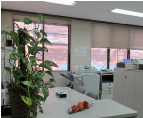
受付もおしゃれです