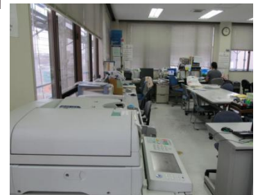
コピー機と印刷機が並んでます